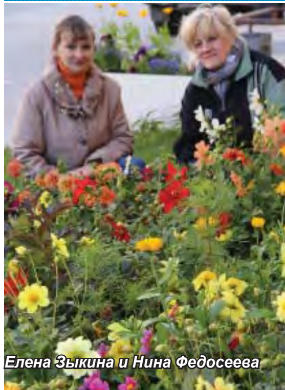
Елена Зыкина и Нина Федосеева