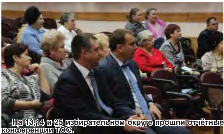
На 13,14 и 25 избирательном округе прошли отчётные конференции ТОС.